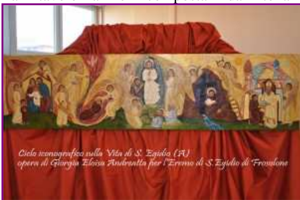
Ciclo iconografico sulla Vita di S. Egidio (A) opera di Giorgia Eloisa Andreatta per l'Eremo di S. Egidio di Frosolone

Se l'eremita si è potuto interessare esplicitamente forse più ad un ragionamento funzionalistico, all'artista, che pur non sembra ignorare se una certa scena possieda una indiretta potenzialità di condizionamento psicologico alla "funzione religiosa", doveva interessare principalmente la prospettiva artistica del fenomeno. Al primo impatto l'attenzione dell'osservatore è dapprima catturata dal centro della tela, per poi seguire nelle scene il flusso dei personaggi. In una lettura logica, secondo le diacronie dell'esistenza terrena del monaco. Un ritmo lineare ci conduce dall'angolo sinistro del primo quadro al suo angolo destro, passando per il fulcro che è rappresentato dal centro. Le due tavole sono tra loro complementari. Così non si può vedere la seconda senza essere passati per la prima. I colori sono fisicamente ben separati l'uno dall'altro. La tavolozza è composta da tonalità intense, fortemente espressive, per la